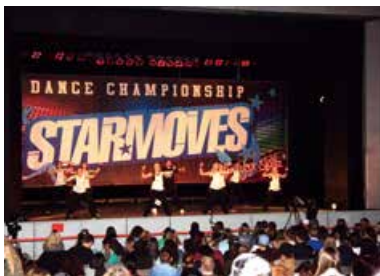
Starmoves Championship - HipHop Tanzwettbewerb für Kids