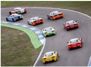
Ferrari Racing Days