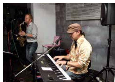
Hockenheimer Nacht der Musik - Duo Hey Babe