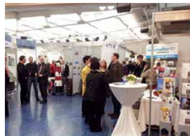
Neujahrsempfang Mit Präsentationsständen der Vereine