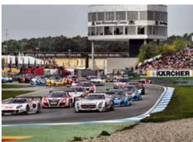
ADAC GT MASTERS