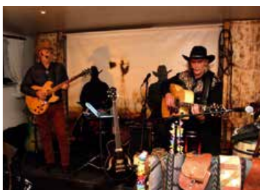
Hockenheimer Nacht der Musik - Kraichgau Cowboys