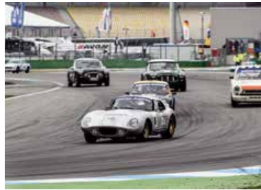
Bosch Hockenheim Historic