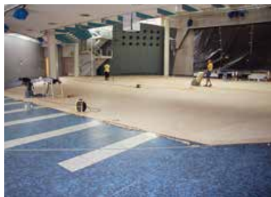
Parkettsanierung Im großen Saal der Stadthalle