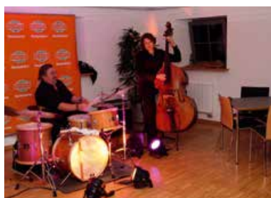
Hockenheimer Nacht der Musik - The Pope of Cheese