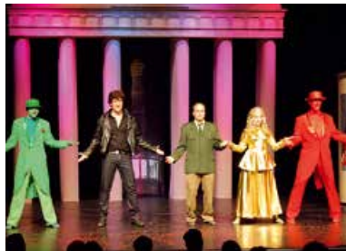
Green Boys Die Ampelmännchenshow aus Berlin