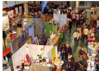
Hockenheimer Advent Der 23. Weihnachtsmarkt