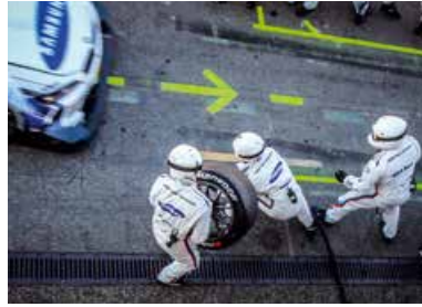
DTM Finale Boxenstopp