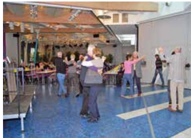
Kerwefrühshoppen Traditioneller Frühshoppen