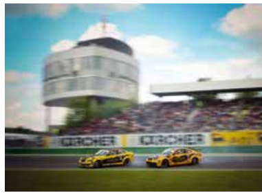
High Performance Days Drift Challenge