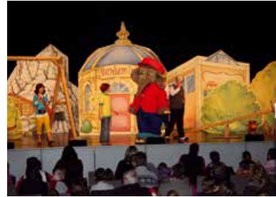
Benjamin Blümchen Die elefantastische Show