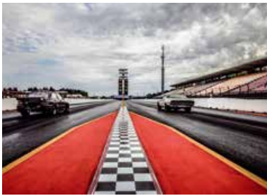
Public Race Days