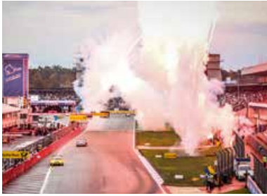
DTM Finale Zieleinfahrt