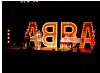
DancingQueen ABBA-Show Das 40-jährige Erfolgsmusical aus London