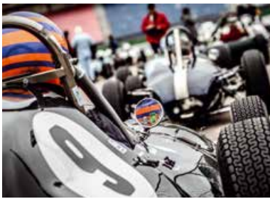
Bosch Hockenheim Historic