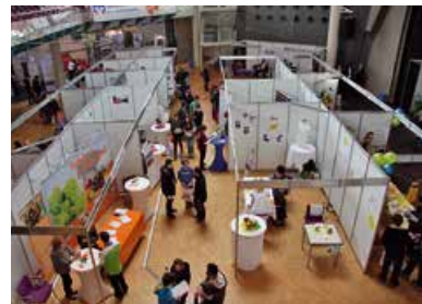
Messestände beim 9. Hockenheimer Ausbildungstag mit 48 Ausstellern