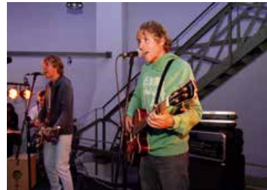
Hockenheimer Nacht der Musik - Used