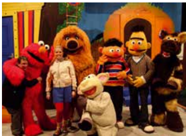
40 Jahre SESAMSTRASSE Die spektakuläre Geburtstagsshow