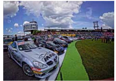
High Performance Days