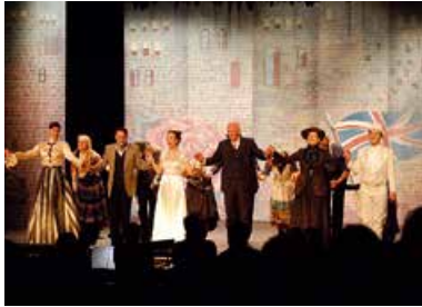
My Fair Lady Weltbekanntes Musical, brillant inszeniert